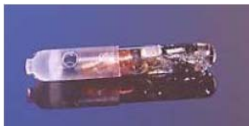
Figure 5 - Exemple de puce électronique

Ce dispositif (figure 5) est lu électroniquement et les informations sont emmagasinées dans une banque de données nationale, accessibles par tous les maillons de la filière, grâce à un code d'accès. Ce système n'est pas beaucoup utilisé au Brésil car son coût est élevé.