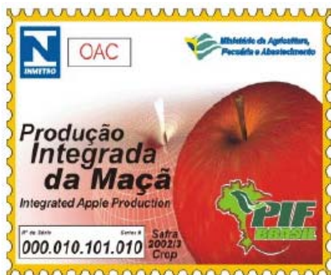
Figure 10 – Sigle PIM

La culture de la pomme est la première à avoir des directives et des normes spécifiques définies et réglementées par le MAPA - ministère de l'agriculture, élevage et approvisionnement. Ses fruits sont identifiés avec le sigle d'évaluation de conformité (Figure 10) délivré par le MAPA et l'INMETRO - Institut national de métrologie.