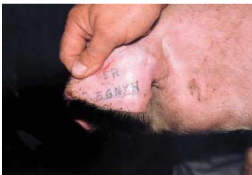
Figure 8 – Tatouage à l'oreille

Les animaux doivent posséder, en outre, un passeport animal consignait toutes les informations requises par le programme et qui devra les accompagner dans tous leurs déplacements.