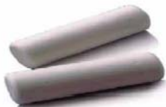
Figure 6 - Bol alimentaire

Le bétail peut aussi être identifié à partir d'un bol alimentaire électronique (figure 6) qui, d'après Ferreira & Meirelles (2002), est l'une des méthodes les plus sûres et les plus efficaces. Cependant, le coût élevé de ces équipements et la durée de son implantation ont rendu son utilisation difficile. Son inclusion est faite dans le corps des animaux et doit être réglementée par une législation spéciale.