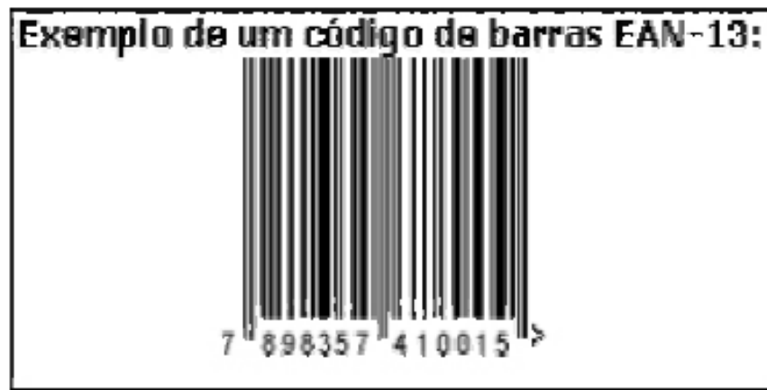
Figure 11 – Code-barres standard EAN/UCC

EAN 8, EAN 13, EAN 14, EAN/UCC 128/ ITF, UPC-A e RSS (Figures 11 et 12).