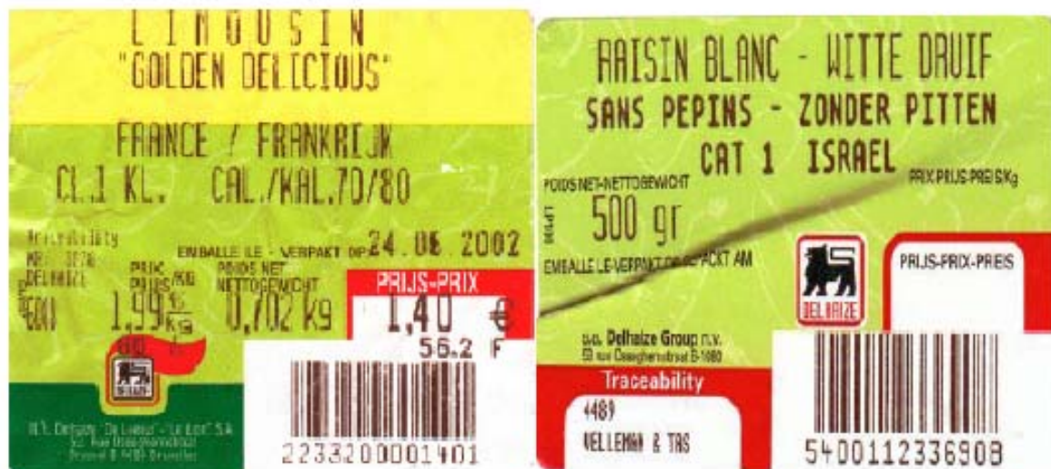
Figure 12 – Exemples d'étiquettes de pommes et raisin.

Les numéros d'identification doivent être appliqués et enregistrés de manière à créer un lien entre les configurations successives de conditionnement, de transport et de stockage . Certaines données doivent être transférées via système entre les partenaires, alors que d'autres sont seulement enregistrées. Les données pourront être transférées par voie télématique et reliées aux numéros d'identification des unités logistiques. Pourront être utilisés des tapis transporteurs, accouplés à un système de sélection par taille et coloration (scanneur) avec étiquetage automatique de codes-barres.