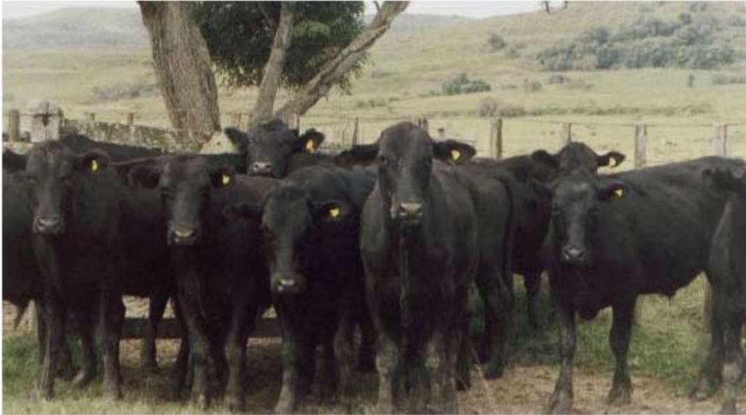
Figure 4 – Bétail identifié avec des boucles plastiques auriculaires