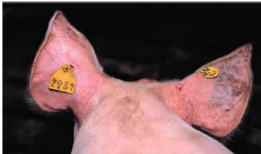
Figure 7 – Identification avec des boucles auriculaires plastiques

Les porcins sont identifiés individuellement avec des systèmes d'identifications à l'exemple des bovins, comme le tatouage et les boucles auriculaires (figures 7 et 8).