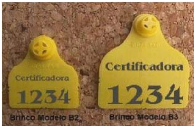
Figure 3 - Exemples de boucles d'identification visuelle

Le Brésil a choisi l'utilisation de boucles auriculaires électroniques comme solution plus accessible aux éleveurs, bien que son coût représente environ 80 % du coût total de l'enregistrement de l'animal dans le système de traçabilité. Elles peuvent être incorporées à un transpondeur et la lecture peut se faire par affichage digital ou encore par code-barres, mieux adapté à notre réalité car plus simple et moins cher.